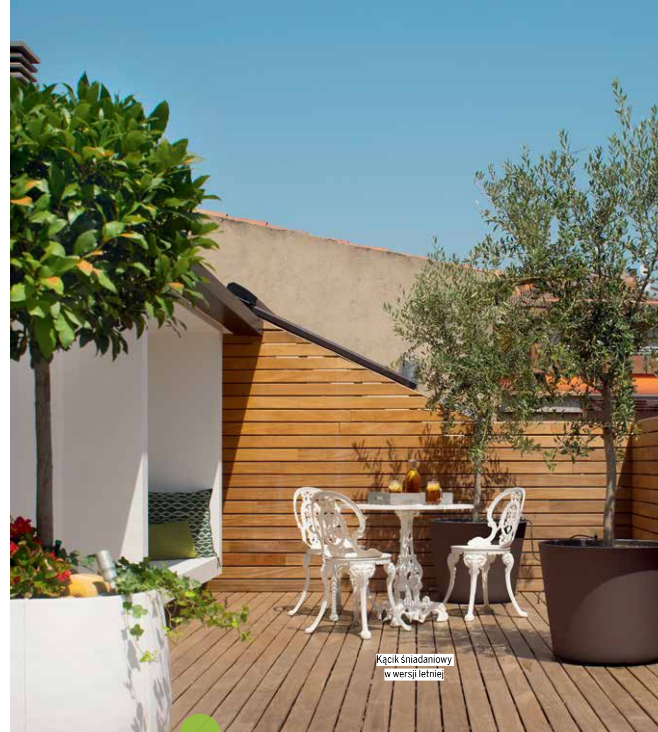
Kącik śniadaniowy w wersji letniej