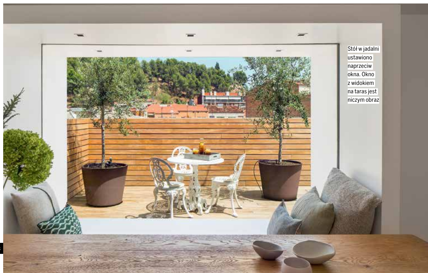
Stół w jadalni ustawiono naprzeciw okna. Okno z widokiem na taras jest niczym obraz