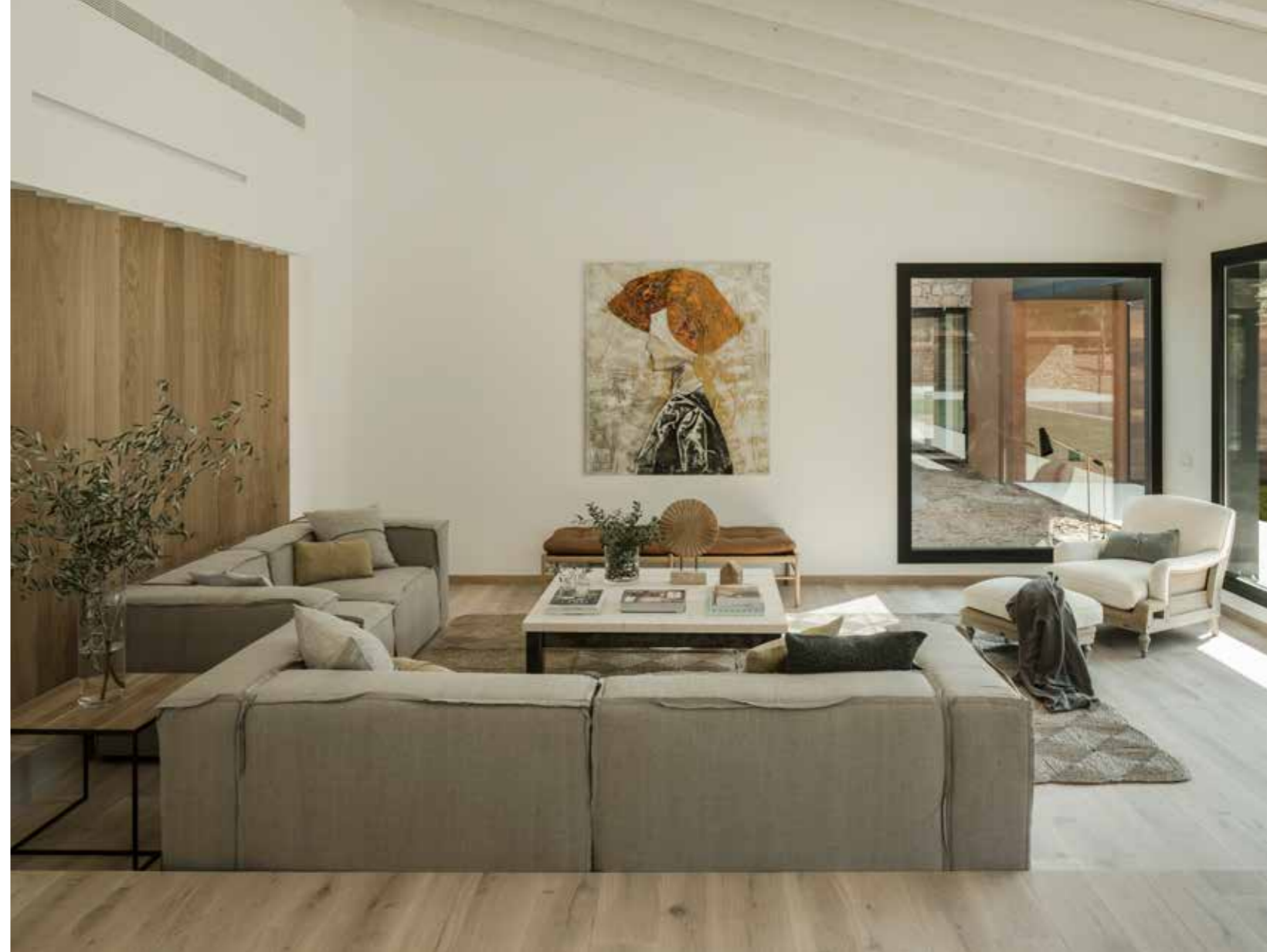
La sala de estar está equipada con sofás de Dareels -decorados con cojines de Teixidors- y mesa de centro de Decosingular. En la esquina, butaca de Create Collections. Bajo el cuadro, procedente de la galería L'Arcada, banco de Carl Hansen & Son. En la otra página , el comedor, iluminado por una lámpara de Artemide, con mesa de 555 Project y sillas de Dareels. El cuadro es de L'Arcada.