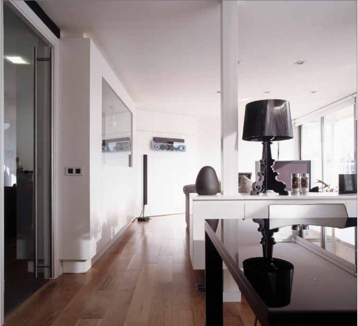
Dans ce duplex à Barcelone (photos de cette double page), Susanna Cots a conçu un intérieur très épuré. Elle a par ailleurs créé des volumes de verre pour unir des espaces. Et offrir davantage de lumière à cet appartement donnant sur les toits de la ville.