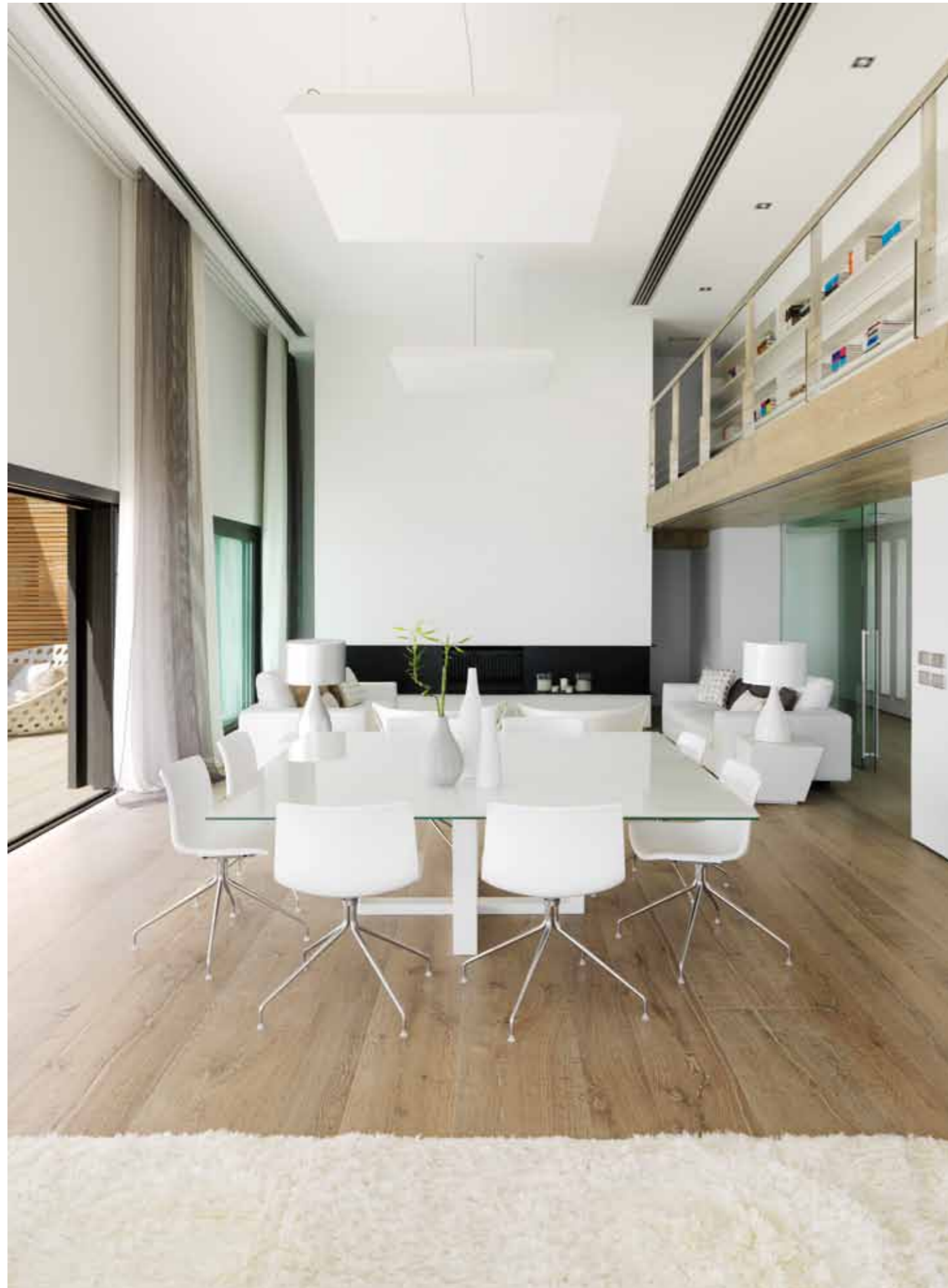
Matrummets dubbla takhöjd skapar en fantastisk rymd.