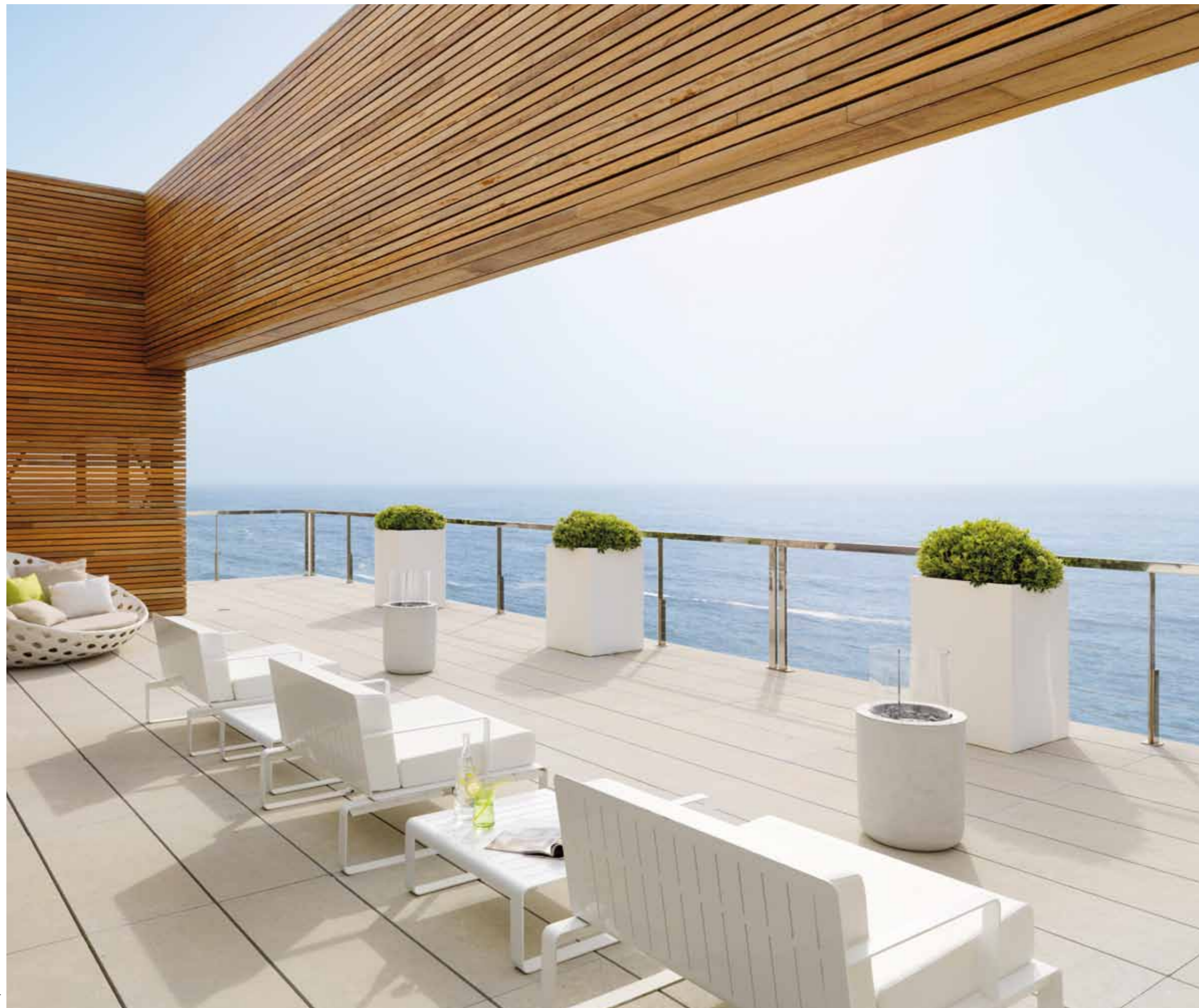
Takterrassen bjuder på obruten utsikt mot horisonten.

Text: MATS ERIKSSON