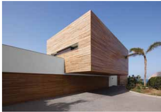
Den vackra träfasaden skapar en varm, välkomnande känsla.

HÄR I SVERIGE har det helvita, avskalade nästan blivit en kliché och begreppet "ljus och fräscht" är inte längre nödvändigtvis en komplimang. Men ibland är det just vita toner som bäst tar tillvara naturens skönhet. Så är definitivt fallet när det kommer till det här fantastiska huset vid Andalusiens kust. Beläget högst upp på en klippa, precis vid det hänförande vackra Medelhavet, fångar den vita färgen upp det naturliga ljuset och skänker huset ett nästan magiskt skimmer.