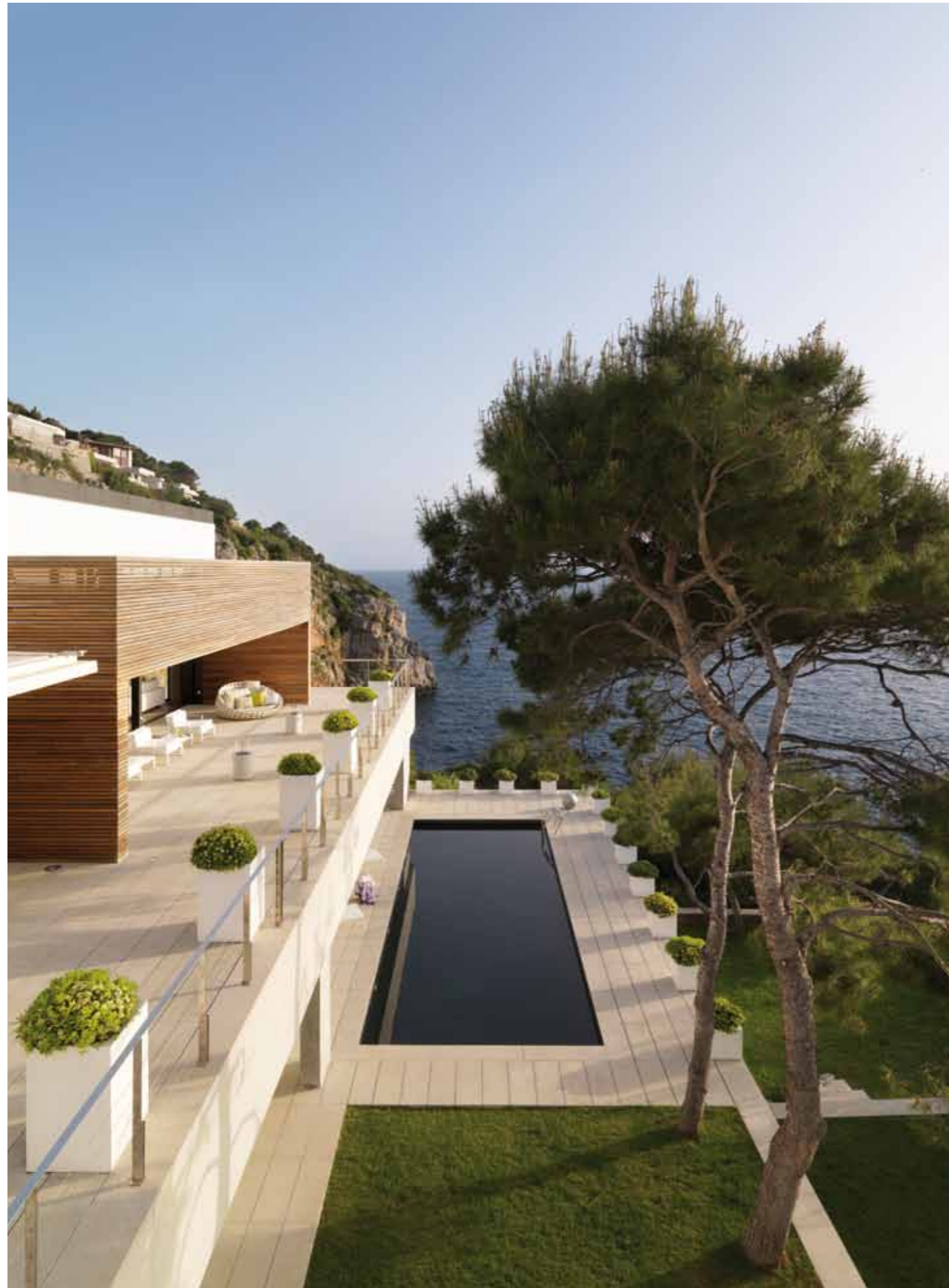
Rektangulära former präglar även trädgården.