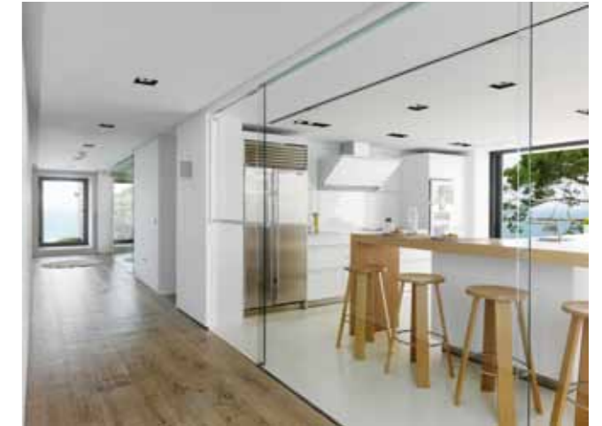
De många glasväggarna gör att huset känns öppet och inbjudande.

PÅ ÖVERVÅNINGEN , som är konstruerad som en kub, ligger husets master bedroom. Här har husets ägare en avskild plats att dra sig tillbaka till, en plats som föga förvånande är inredd helt i vitt. Undantaget är badrummet, där den vackra och mörka vulkanstenen basalt täcker väggarna. I barnflygeln, som förutom badrummet är den enda delen av huset där väggarna inte är helt vita, finns sovrum och ett lekrum för de små. Slutligen finns en del för gäster, belägen på bottenvåningen med utsikt över swimmingpoolen. Gästrummens golv är av samma material som området utanför, vilket gör att insidan integreras med poolområdet.